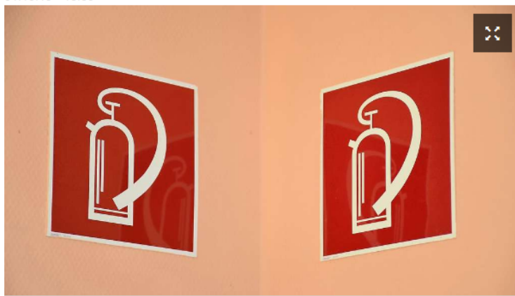
Es sollte eine Brandschutzübung sein - doch die ging schief: Ein explodierender Feuerlöscher hat eine Frau schwer im Gesicht und am rücken verletzt.

Bei einer routinemäßigen Brandschutzübung im Seniorenheim „Haus am Nordwall“ ist ein Feuerlöscher explodiert. Dabei wurde eine 53-jährige Mitarbeiterin schwer verletzt.